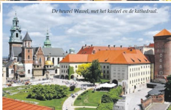
De heuvel Wawel, met het kasteel en de kathedraal.

In het Poolse Krakau vinden komende zomer de Wereldjongerendagen plaats. De stad en omgeving zijn rijk aan historie en bezienswaardigheden. De Poolse Organisatie voor Toerisme nodigde KN uit voor een bezoek aan de stad. We waren meer dan aangenaam verrast. Een bezoek aan Krakau is zeer de moeite waard.