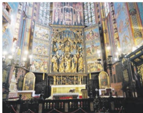
Rechts: het imposante hoogaltaar van de veertiende-eeuwse Mariabasiliek.

Absoluut hoogtepunt van de zoutmijn is de op honderd meter diepte gelegen unieke kapel, vernoemd naar Sint-Kinga, de patrones van Polen en Litouwen. Kinga, achternicht van Sint-Hedwig, was getrouwd in een Jozefhuwelijk met Bolesław V, prins van Krakau. Ze stond bekend vanwege haar liefdadigheidswerk. Na de dood van haar man verkocht ze al haar bezit, gaf het geld aan de armen en trad in bij de arme klaren.