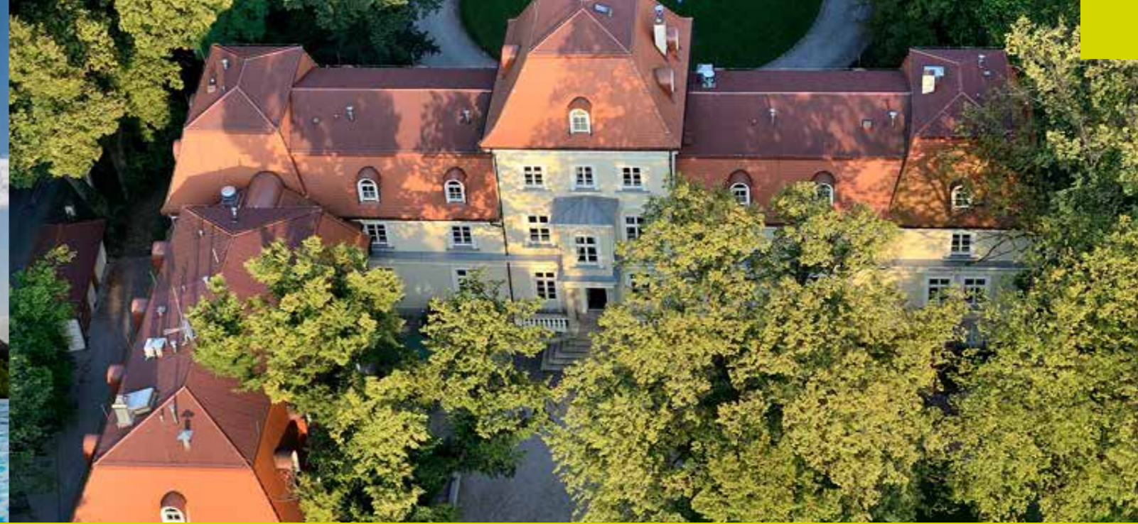
سير اكوف مانور

ومنحدر تزلج يقع بجوار الفندق مباشرة، وناديًا، وحدائق جبال، وملعبًا رياضيًا وملعب تنس.