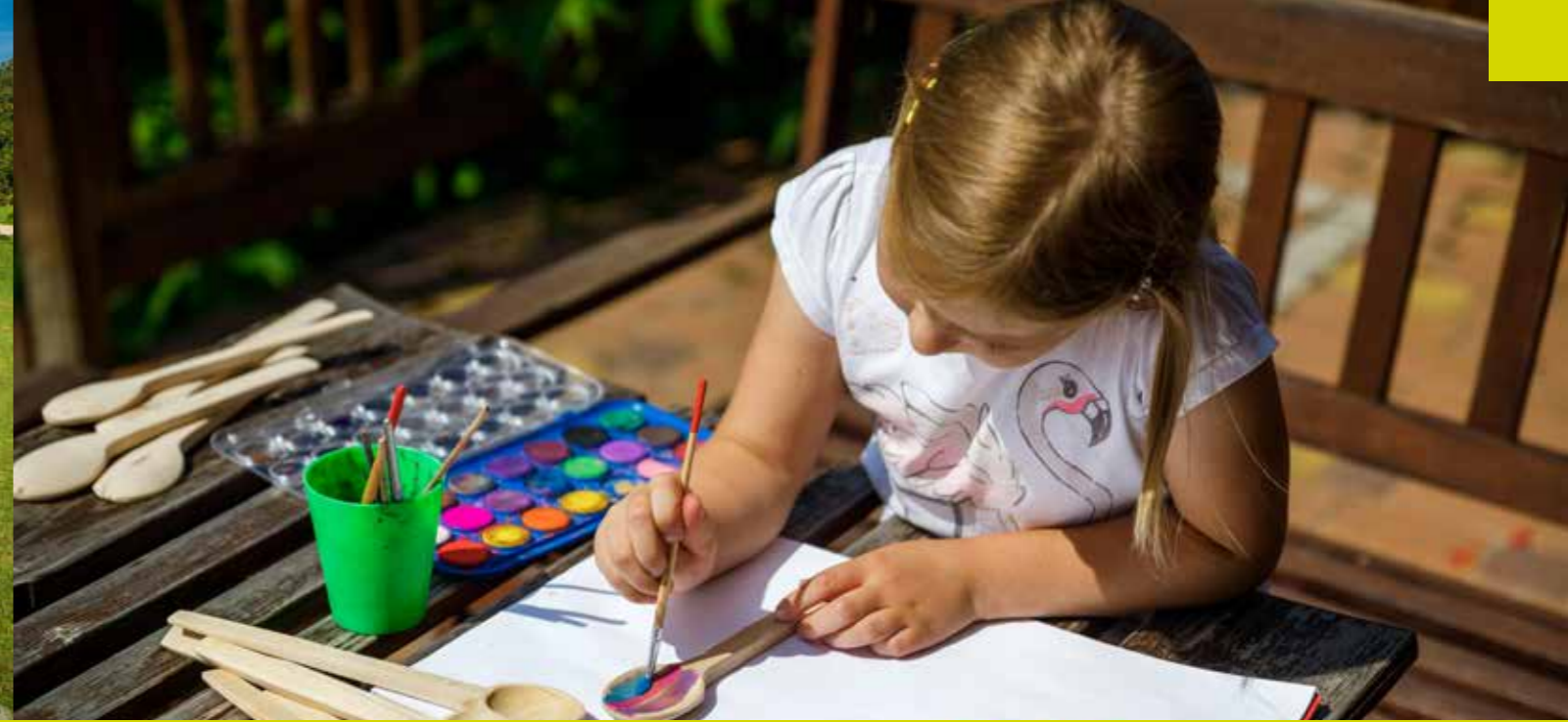
عوامل جذب للأطفال

توجد في إينفالد 5 حدائق ترفيهية توفر متعة استثنائية والكثير من المفاجآت. يمكن للضيوف زيارة متحف المجسمات التاريخية المصغر