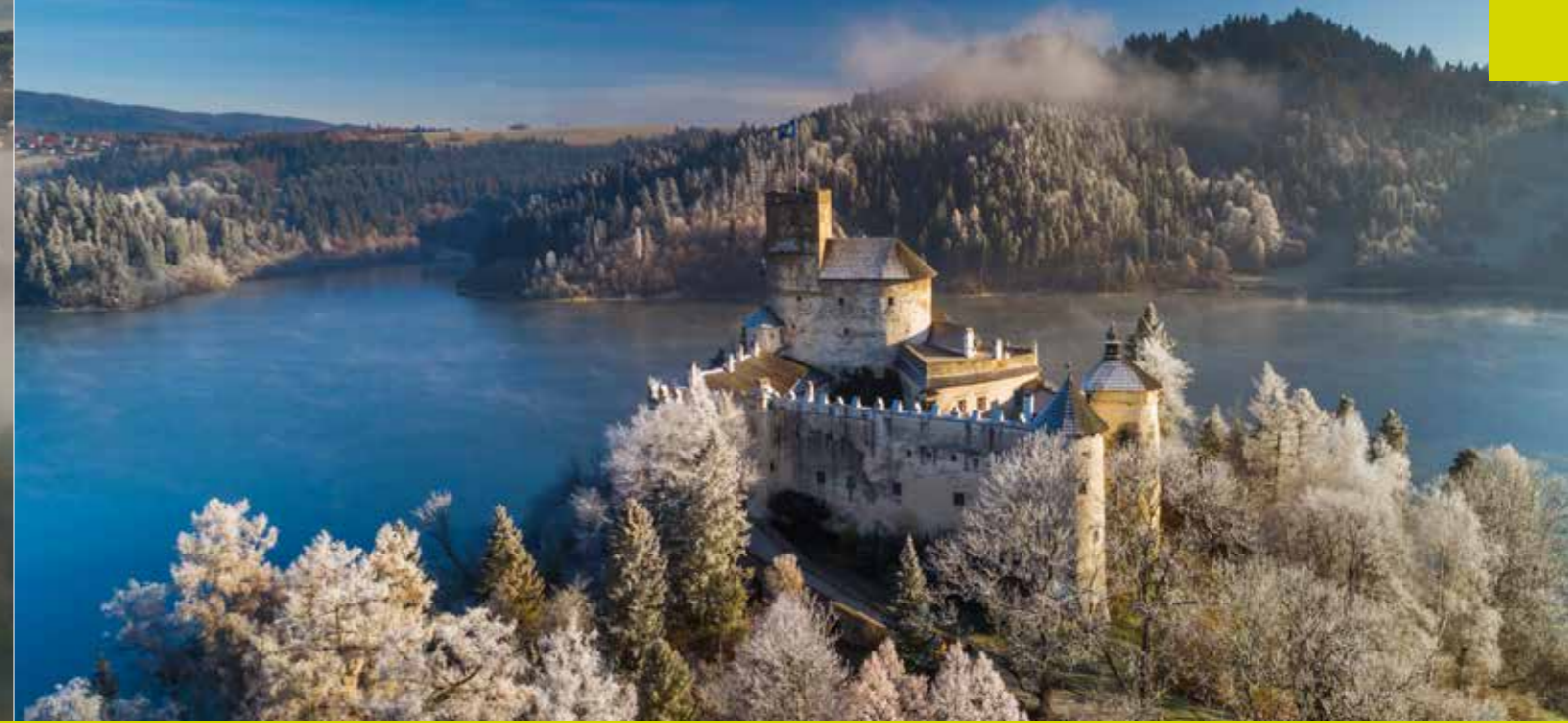
القلع في تشورشتين ونيادزيتسا

تم بناء قلعة بياسكوفاسكالالا في القرن الرابع عشر. ونتيجة لإعادة بنائها والتوسيع اللاحق لتحسيناتها، أصبحت الآن مقرًا على طراز عصر النهضة المعماري. في الداخل، يوجد فرع متحف يضم