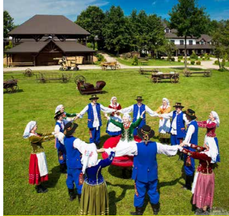
ازياء شعبية، فولفارك زاليسيا

تم إنشاء متحف «أوبفارز انيك» في كراكوف لإحياء ذكرى الذر رمز لهذه المدينة، حيث أن مخبوزات «الأوبفارز انيكات» تباع يوميًا بـ 150 ألف قطعة، وتتميز بأكثر من 600 عام من التقاليد، وهي علامة المؤشر الجغرافي المحمية للاتحاد الأوروبي، مما يؤكد على أهميتها لتراث الطهي في كراكوف. في المتحف، يمكنك التعرف على تاريخ خبز «أوبفارز انيك» والعملية الفريدة لصنعه. كل من حضر ورش العمل هناك يعرف أن الخبز المحلي الصنع هو الأفضل في العالم.