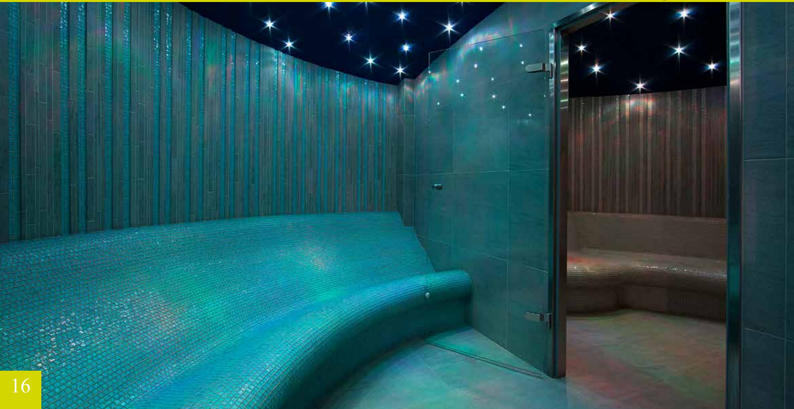
فندق نيابياسكي أند سبا

فندق بوكوفينا هو مبنى فاخر يقع في قرية ساحرة في المرتفعات – بوكوفينا تاترزانسكا. وهو يوفر عطلة سعيدة مع إطلالة رائعة على جبال تاترا. تدعوك المطاعم المحلية إلى رحلة طهوية عبر نكهات بودهالي، والتي تعتمد بشكل أساسي على المنتجات المصنوعة منزليًا، وتغريك منطقة العافية والسبا بعلاجات الاسترخاء. بجواره، توجد حمامات حرارية شهيرة