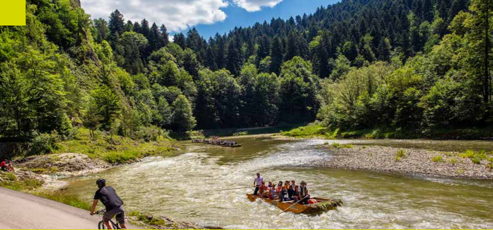
رحلة نهر دونابيتس

لعشاق العجلتين والرياضات الشتوية مكانهم الخاص أيضًا في جبال بيانيني. بالنسبة لراكبي الدراجات، فإن ما يلي يستحق التوصية بشكل خاص: درب بيانيني، أي المسار الأحمر على طول مضيق نهر دونابيتس، بدءًا من شتشافنيتسا وفيلودونابيتس، الذي يعتبره الكثيرون أجمل طريق لركوب الدراجات في بولندا. توفر محطات التزلج في شتشافنيتسا ويافوركي ونيادزيتسا وكروستينكو تجارب لا تُنسى للضيوف الذين يزورون بيانيني في فصل الشتاء. في هذه المناطق، يمكنك الاعتماد على طرق عالية المستوى بدرجات متفاوتة من الصعوبة. المنتجعات ذات الموقع الخلاب والبنية التحتية السياحية المتطورة، والتي تضمن الاسترخاء والترفيه والمأكولات الجيدة للمتزلجين المرهقين، وهي أسباب أخرى تدفع الناس لزيارة هذه الأماكن.